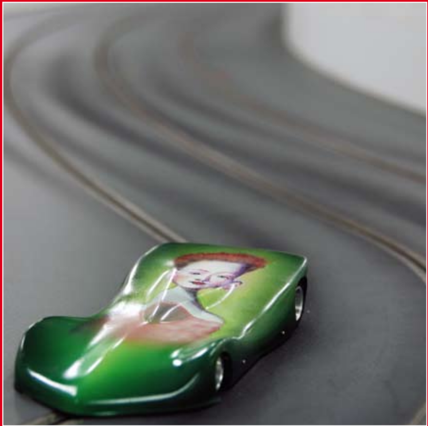
Mongoose revenge, 2008