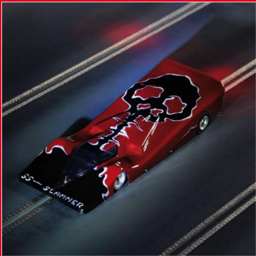
Super Slammer, 2008