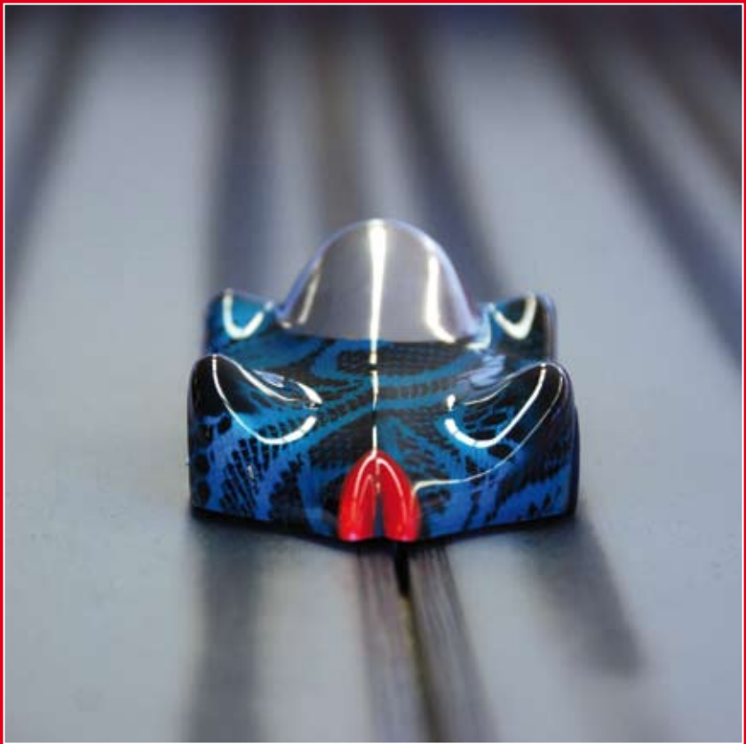
Python kiss, 2008