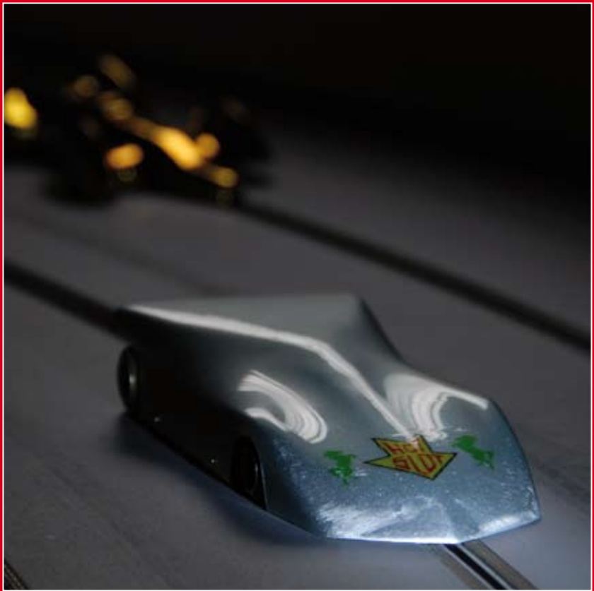
Hot slot, 2008